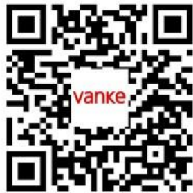
万科集团招聘微信公众号 (关注了解更多信息)