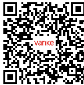
校招官网二维码 (可进行投递简历)

4、欢迎登陆万科官方网站 ( https://www.vanke.com/home )，了解更多招聘信息。